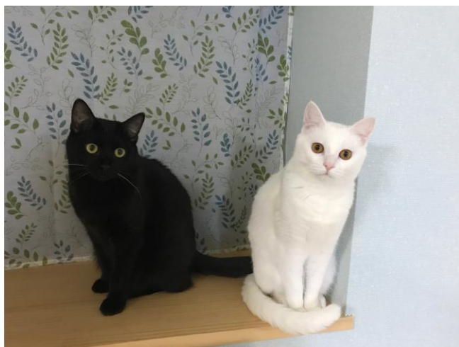
メルトくん(男の子・左) ルウちゃん(女の子・右)

誕生日・年齢 9月20日生まれ 誕生日で5歳 性格 いつも1人で留守番、賢い犬です。 明るく、人懐こく、甘えん坊な女の子。 (西坂工務部長)