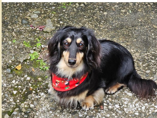
ひなちゃん(女の子)

誕生日・年齢 9月20日生まれ 誕生日で5歳 性格 いつも1人で留守番、賢い犬です。 明るく、人懐こく、甘えん坊な女の子。 (西坂工務部長)