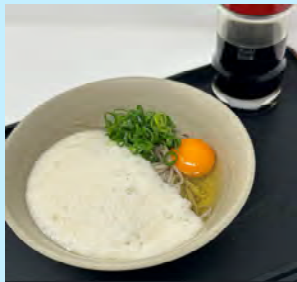
山かけ醤油そば 1玉 700円 2玉 900円