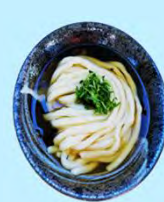
ぶっかけうどん 350円