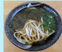
とろろ昆布うどん 500円