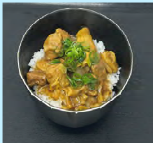
牛すじカレー丼 550円