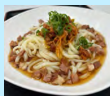
ピリ辛 ネギチャーシューうどん 650円