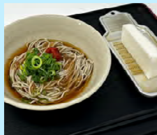
梅おろしぶっかけそば 1玉 600円 2玉 800円