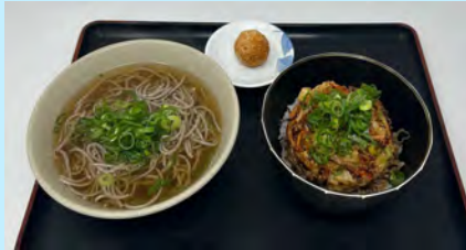
Aセット かけそばorぶっかけそば + かき揚げ丼