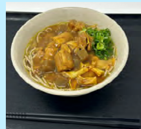
牛すじカレーそば 1玉 800円 2玉 1000円