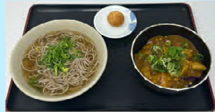
Bセット かけそばorぶっかけそば + 牛すじカレー丼